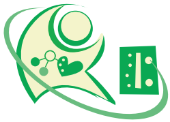
第47回 日本人工臓器学会大会