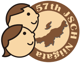
第57回日本小児保健学会